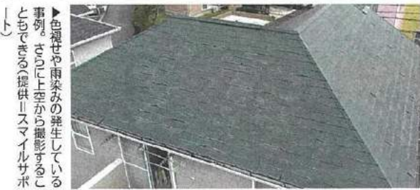
▶色褪せや雨染みの発生している事例。さびの上から撮影することもできる

約2万4000戸を管理する一誠商事(茨城県つくば市)は、管理物件の点検にドローンを活用。実際に調査を行うのは、グループ会社で原状回復工事などを手がけるスマイルサポート(同)だ。 年間100件の調査のうち、ドローンを活用するのは30件ほど。隣接する建物との距離が近く、屋根までは手をかけられない物件や、屋根の勾配が急な戸建て賃貸の場合、ドローンを活用しているという。 利用目的は、