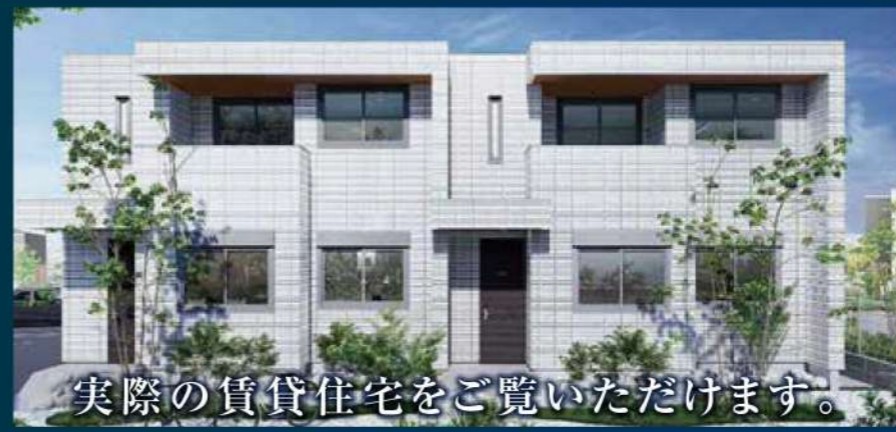
実際の賃貸住宅をご覧いただけます。

0120-298-266 [営業時間] 10:00~18:00 [定休日] 火曜・水曜