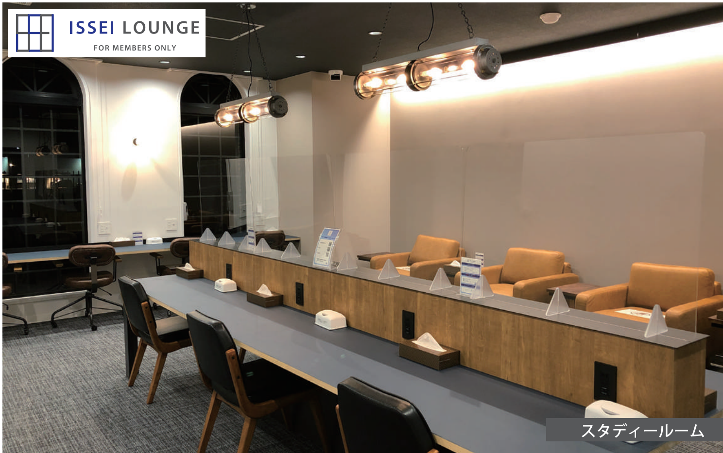
スタディールーム