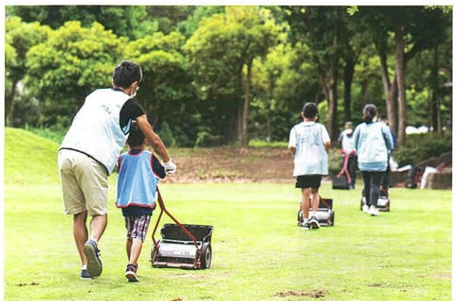
各種CSR活動を通じてまちの魅力向上にも貢献

当社としましても、本業である不動産事業とともに、地域住民主体の公園芝生育ボランティア団体「つくばイクシバ！」への参画など、様々な地域貢献事業を通じて、地域の皆様の快適な暮らしと循環型社会の形成に貢献してまいりたいと考えております。